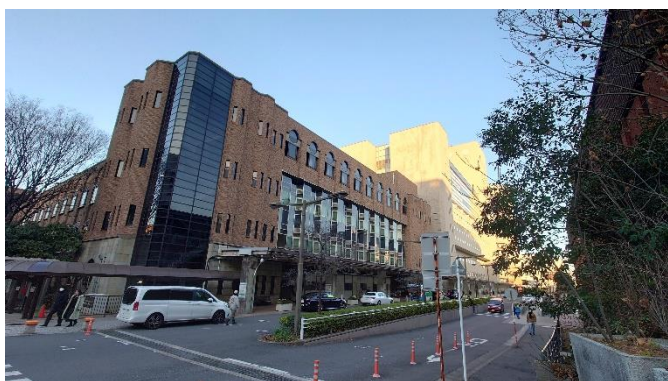
東京大学医学部 附属病院の外観