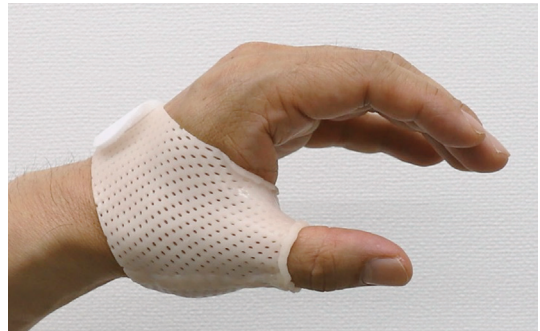
短対立スプリント