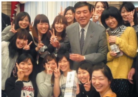
交流会場にて石破農水大臣と記念撮影

地道にコツコツとあるいは、感性を磨いて試行錯誤しながら…頑張ったみんなの成果を報告します!