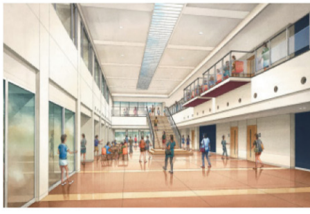
新校舎アトリウム

人がいたはずですが、「将来こんな人になってみたい、この人のように輝きたい、こんな働き方をしてみたい」こんなことを感じる人が、あなたの人生の生き方モデル、ロールモデル(お手本)なのです。目標になる人生の先輩を探すことは、あなたが「どんな仕事か」とか、「どんな仕事か」を知る手がかりにもなります。 何より大切なことは、不況下の不透明な時代だからこそ、与えられるのを待つのではなく、積極的に行動の力で食べていける実力をつけて納得のいく人生を過ごしてください。 学生が自らの適性を理解し、単なる就職対策ではなく「社会人としての人間力育成」が図れるようなセミナーや就職講座を実施し、