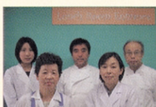
▲毎日おいしいランチを作っているみなさん

生きていく上で欠かせない「食」 あなたはどこまでKASEIの「食」について知っていますか?