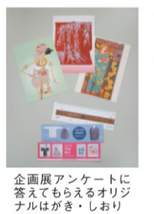
★最新情報は博物館HPで。 企画展「アンケータリ」のポスター 2011年4月開催

料のイベントに参加するの も楽しみ方のひとつです。 ●もっと知りたい! お気に入りの展示品につ いてもっと知りたいと思っ たら、図書館で関連書籍を 探しましょう。展示品につ いての知識が深まるだけ なく、さらにその先へ興味 を広げることが出来ます。