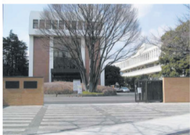
修復・改修後の正門

昭和21年、本学が本郷湯島から板橋の地に移った当初、校地が広大な旧軍敷地の頑丈な塀の中の東北隅に