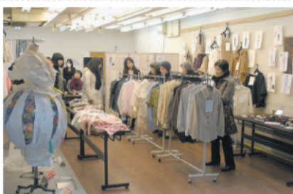
店内に並ぶシャツや子供服など