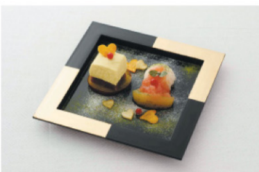
「美濃吉」副料理長と学生考案のメニュー

本学栄養学科・栄養科の学生15名と池袋東武百貨店スパイスレストラン街とのコラボレーション企画「りんご&さつまいもコラボスイーツフェア」が2月1日〜28日開催されました。今回で15回となるこの企画。6大学(大妻女子大学・実践女子大学・淑徳短期大学・女子栄養大学短期大学部・目白大学・本学)が協力し、「りんご」と「さつまいも」を使ったスイーツ44品