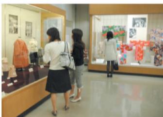
企画展の様子2008年5月 「わたしの服・ぼくの服」

今年、常設展で主要コレク ションをすべて紹介します。 予備知識が無くても楽しめ ますので、空いた時間にふ らっと立ち寄ってください。 一人で気ままに見るもよし、 友人や家族を誘って見るも よし。