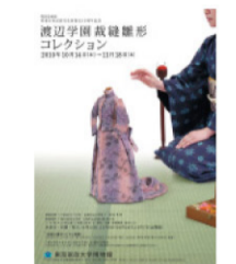
企画展「渡辺学園 縫製雛形コレクション」のポスター 2010年10月開催

今年、博物館は開館30周 年を迎えます。学園創立1 30周年と比べるとまだまだ だ、と思われられるかもしれ ませんが、実は学園創立時か ら教育研究用に服飾資料の 収集が行われていました。 つまり博物館の活動はこの 頃から始まっているのです。 関東大震災や東京大空襲と いう困難を乗り越え、昭和 56年に待望の「生活資料館」 が開館します。そんな歴史 のある博物館ですが、もっ と気軽に利用してほしい! というわけで博物館の魅力