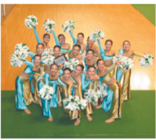
高等学校ドリルチーム

平成22年11月末、東京体育館にて行われた、第十回全日チアダンス選手権大会にて審査員特別賞を、受賞しました。