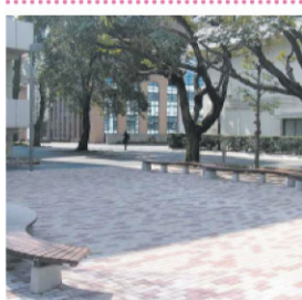
新しくなった憩いの場

多くの学生・生徒・教職員が利用している85周年記念館横の広場が、整備されました。ブロック舗装され、波型のベンチを置くことで柔らかな印象に。樹木も剪定され、すっきりとした空間となりました。