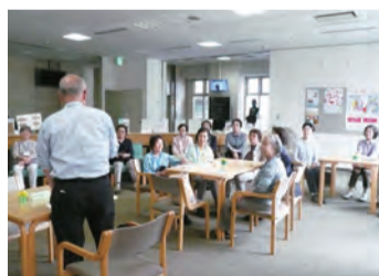
ミニイベントの様子