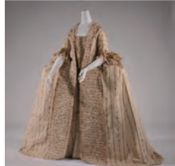
ローブ・ア・ラ・フランセーズ 1780年頃 フランス

ワヤンの実演 インドネシアの伝統芸能である影絵芝居「ワヤン・クリ」。第8回となる今回の実演では、創作のワヤン劇をご覧いただけます。影と色彩が作り出す幻想的な世界をお楽しみください。 日時 9月24日(土) 14時開演(13時30分開場) 場所 120周年記念館1階 多目的ホール 演目 「満月の夜のリムプ」 観覧無料・事前申込み不要 途中入場・退出も可能です。 お気軽にご来場ください。