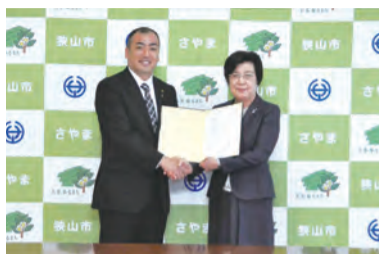
小谷野狭山市長と川合学長