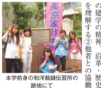
本学前身の和洋裁縫伝習所の 跡地にて