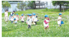
「おべんともってはらっぱへ」

り、学内の原っぱへ散歩に出かけるなど、自然とたくさん触れ合う中で、身体を動かしたり、好きな遊びを楽しんだり、保育者や友達と一緒に過ごす中で安心して生活が送れるようになってきています。 保育者に親しみが持てるようになり、幼稚園で安心して過ごせるようになってきた年少組。進級したことを喜び、いろいろなことに挑戦している年中組。友達と協力しながら当番活動に張り切って取り組んだり、いろいろな遊びに意欲的に取り組んだりしている年長組。