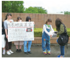
狭山キャンパス 正門前にて

熊本地震の義援金募金活動について 熊本地震によって被害に遭われたすべての方々にお見舞い申し上げます。 本学では公認サークル「ボラガール」を通じて板橋キャンパス・狭山キャンパス内に募金箱を設置し義援金を募っています。また、子ども支援学科有志学生が狭山キャンパス正門前と稲荷山公園駅前に募金協力の呼びかけを行いました。集まった義援金はボラガールの本部であるNPO法人国際ボランティア学生協会(ivusa.com)をとおして現地