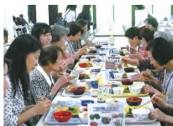
本学 学生食堂にて