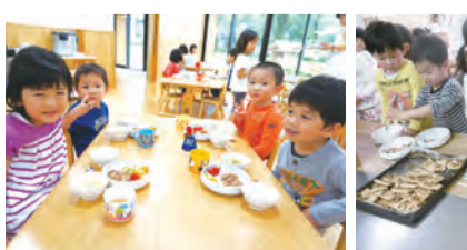
いただきます どのくらい食べられるかな?

4月から3・4・5歳児の異年齢クラスでの生活が始まりました。食事では今までは大人が定量を盛り付けていましたが、今年度から幼児(4・5歳児)は、ピュウフェ形式で食事をしていきます。おかわりの盛り付けのサンプルを見ながら、子どもたち一人ひとりが自分の食べられる量を考えてお皿に盛りつけていきます。3歳児は、大人が盛り付けをしていきますが、果物はトングで自分のお皿に取ります。たくさん食べたい!