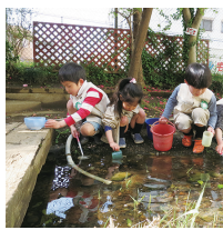
オタマジャクシすくいを楽しむ園児

4月に新しい仲間を迎えて、みどりヶ丘幼稚園の平成27年度が元気にスタートしました。 新入園児の中には、保護者と離れる不安から登園時間に涙が止まらなくなる子もいました。幼稚園という新しい環境にまだ慣れていない子どもにとって、園庭は緊張と不安をいつのまにか和らげてくれる魅力がいっぱいあった場所です。