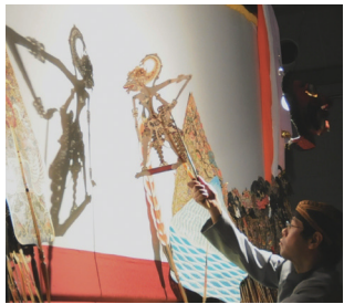
前回の実演の様子

ワヤンの実演 インドネシアの伝統芸能である影絵芝居「ワヤン・クリ」。ワヤン人形を多数所蔵する当館では、毎年ワヤンの実演を行っています。影と色彩が作り出す幻想的な世界をお楽しみください。 日時 9月26日(土) 14時開演(13時30分開場) 場所 120周年記念館 1階多目的ホール 演目 マハーバラタより「カルノの誕生」 観覧無料・事前申込不要 途中入場・退出も可能です。お気軽にお越しください。