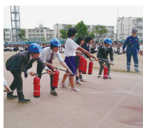
真剣に消火訓練を行う生徒と教職員

「防災訓練を実施しました」 5月12日、板橋消防署ご指導のもと、中高生・教職員の防災訓練を実施しました。