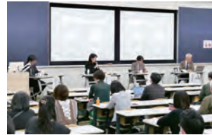
シンポジウム 「造形表現と人間形成」 2023年度開催

博物館の展示や所蔵資料を詳しく解説する講座のほか、展示などのテーマに合わせて、講演会やシンポジウムを開催します。