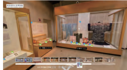
バーチャル展示室「裁縫雛形と自主自律の教え」