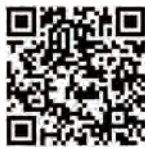
デジタルコンテンツ

展示やイベントなどの最新の情報は、ホームページのほか、Instagramでも発信しています。