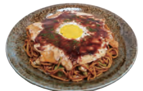
お好み焼き(広島風)