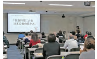
講演会 「家庭料理にみる日本の食の豊かさ」 2024年度開催