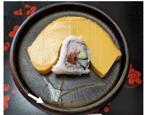
写真 銚子の伊達巻