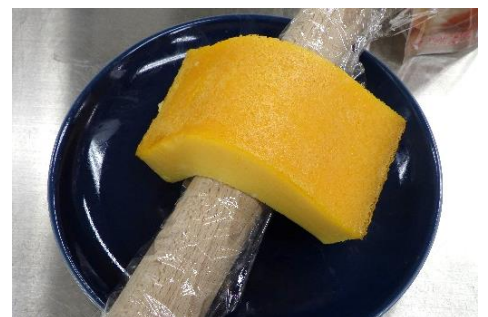
私たちの試作の伊達巻

本研究所で試作してみました。銚子のお寿司屋さんのHPには、手作りで工夫した様子が書かれていました。例えば、手でよく混ぜるのがコツ、裏ごさないというのもあり、火加減がむずかしいと書かれているものもありました。分量はあまり掲載されていませんでした。HPに掲載されていたレシピは、甘さを控えたレシピでしたが、その通り作ってみましたら、残念ながらお酒の味が強く、甘くなく、私の好みに合いませんでした。加熱時間も不足でした。私たちは、卵5個を用い、食べた感じの甘さから砂糖の量は全体の15-17%と推定しました。だしも香っていましたが、かつおだしを用い、