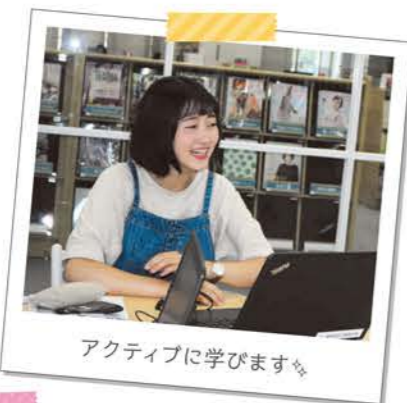
アクティブに学びます