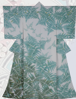
中澤英高《友禅着物 朝もや》 2012年