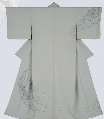
見藤妙子《刺繍着物 風紋》 1980年