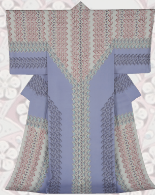
鈴木滋人《木版摺更紗着物 景花》 2012年

「木版摺更紗」、「紋紗」、「友禅」、「日本刺繍」それぞれの技法によって制作された作品は、今日の日本で見失われがちな「日本の美」を思い出させます。新たな試みを取り入れながら進化し続ける「伝統の技と美」をお楽しみください。