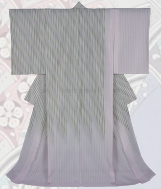
土屋順紀《生絹着物 藤波揺影》 2008年