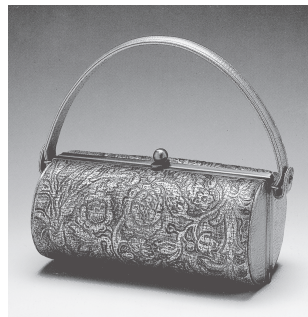
金唐革ハンドバッグ「更紗」