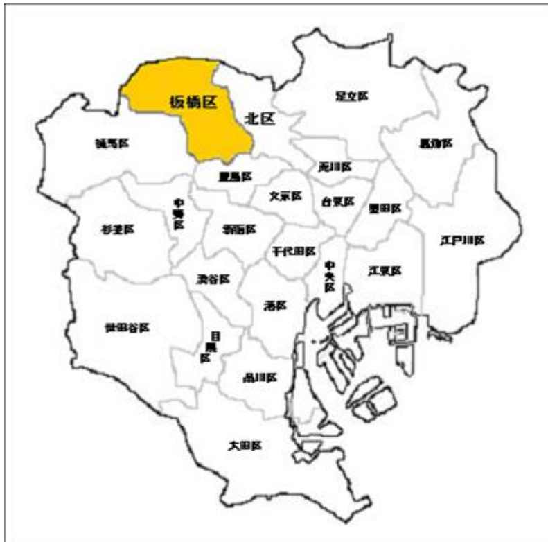
東京都 23 区の地図