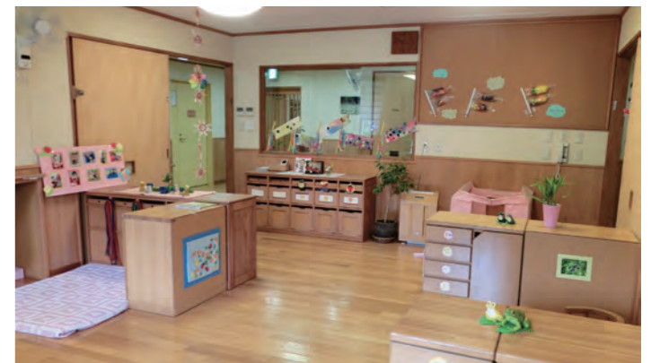
ナースリールーム新園舎保育室