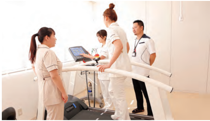
リハビリテーション学科授業風景