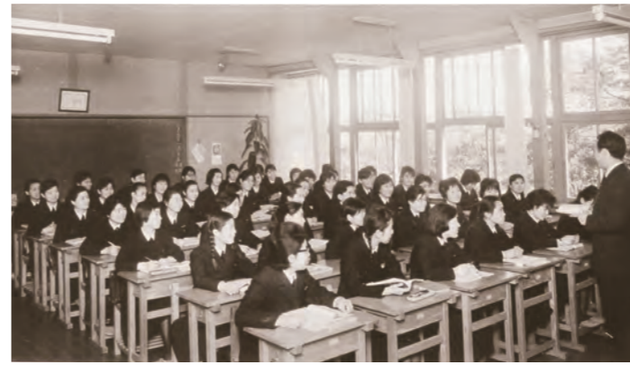
附属女子高等学校の授業風景