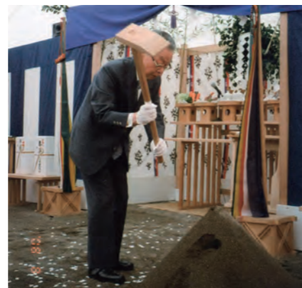
大学16号館新築工事 地鎮祭