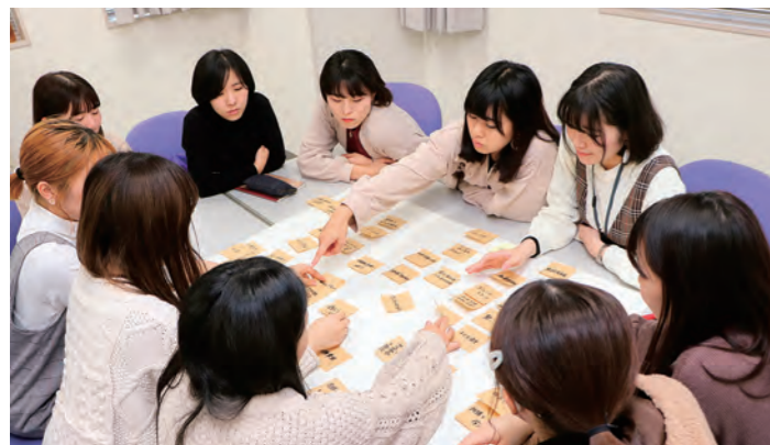
教育福祉学科授業風景