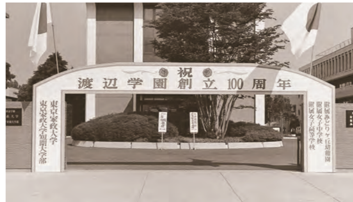
創立100周年記念式典当日の板橋校舎正面