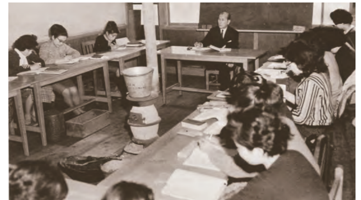
大学の授業風景(教室に当時の唯一の暖房器具である「だるまストーブ」が置かれている)