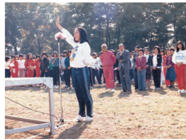
狭山校舎開学記念運動会