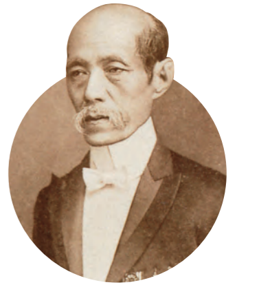
校祖 渡邊辰五郎 わたなべ たつごろう

1844(弘化元)年生まれ。東京家政大学の前身となる私塾を創設。裁縫を通じた女子教育に生涯を捧げた。その画期的な教授法は渡邊式と呼ばれた。