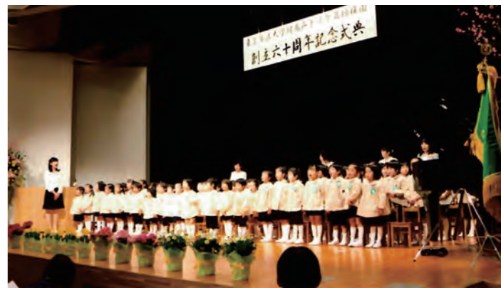
幼稚園創立60周年記念式典