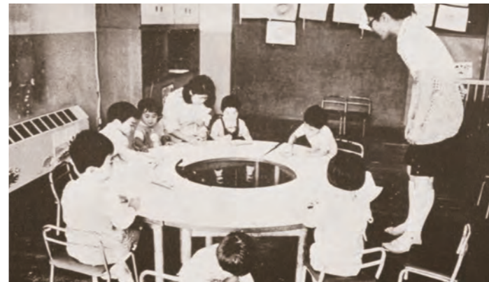
ナースリールの保育風景