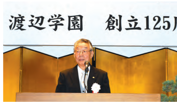
創立125周年記念式典