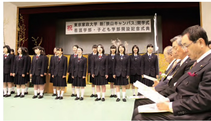
新狭山キャンパス開学式