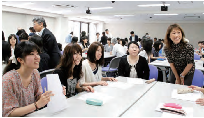
「在学生特待生奨学金」授賞式