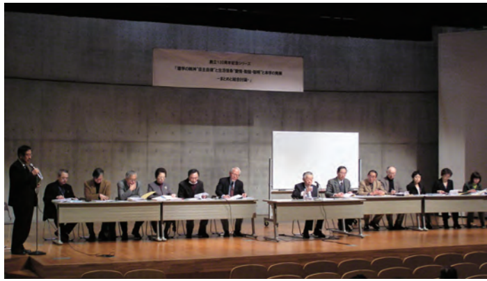
創立130周年記念シリーズ講演