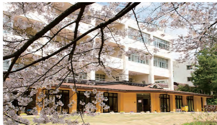
かせい森のおうち