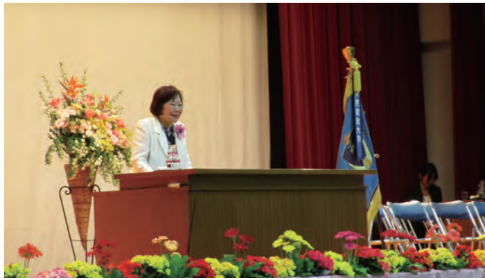
健康科学部への改組及びリハビリテーション学科開設記念講演