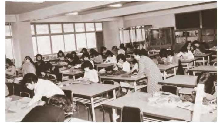
大学の授業風景「洋裁実習」