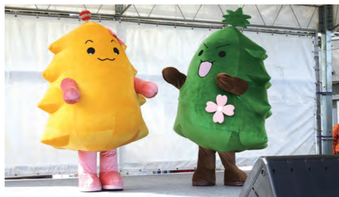
「かせいのモリタン」(右)「かせいのモリリン」(左)お披露目