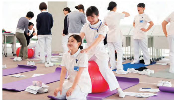
看護学科授業風景