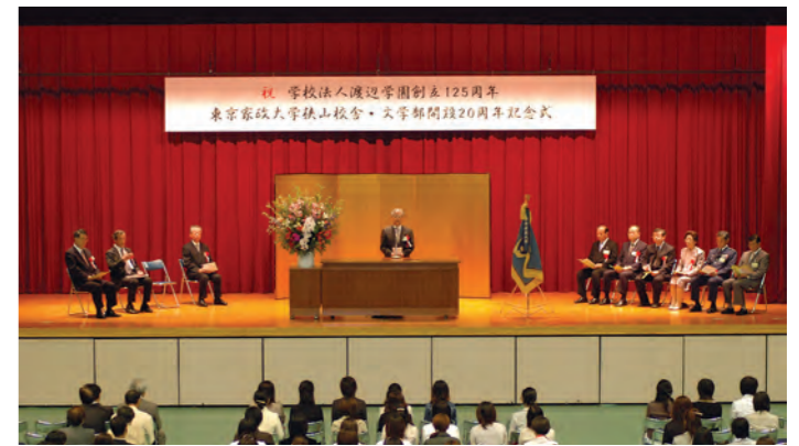
文学部開設20周年記念式