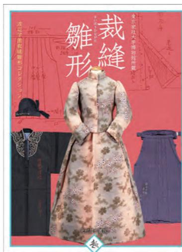
「裁縫雛形 渡辺学園裁縫雛形 コレクション」