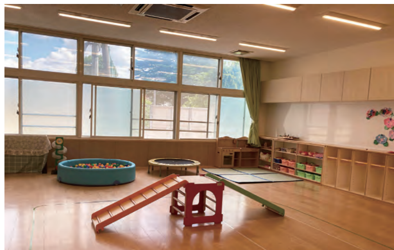
東京家政大学 児童発達支援事業所 わかさ