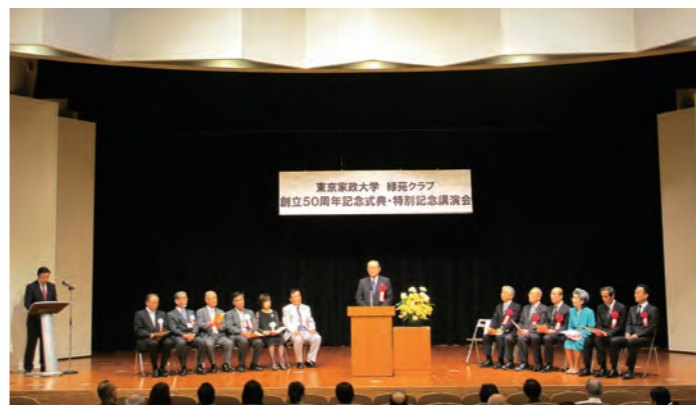
緑苑クラブ創立50周年式典