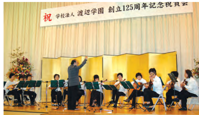
創立125周年記念祝賀会