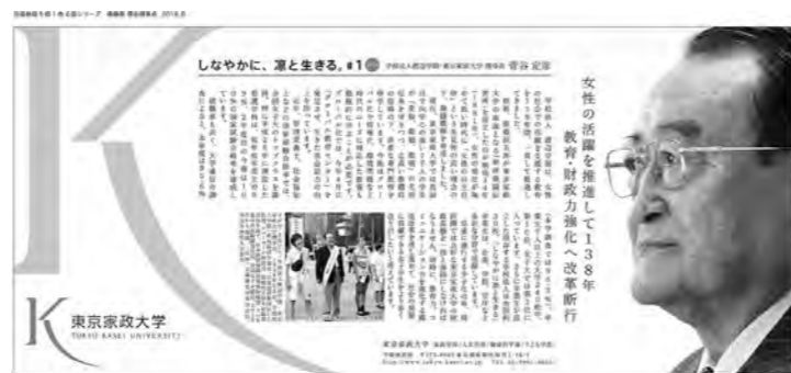
日本経済新聞 朝刊に 6週連続広告掲載