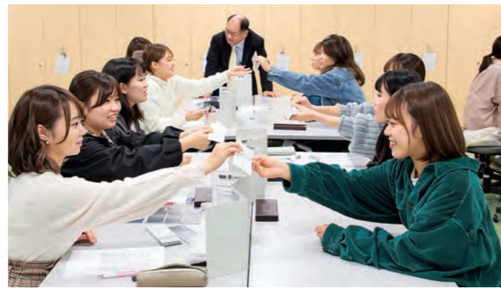
心理カウンセリング学科授業風景