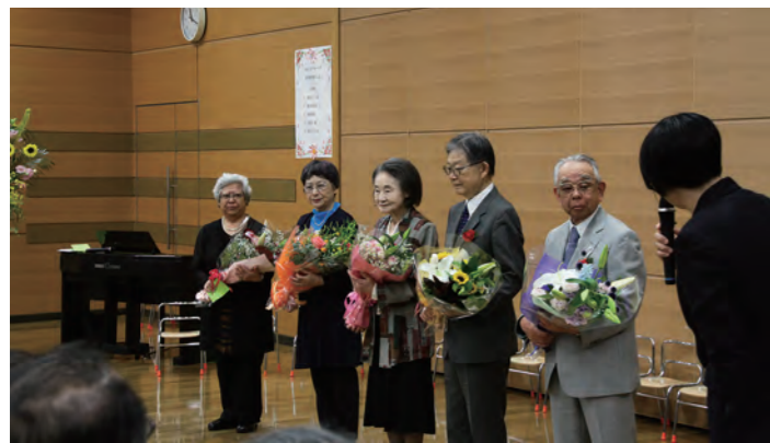
わかかさグループ創立50周年式典