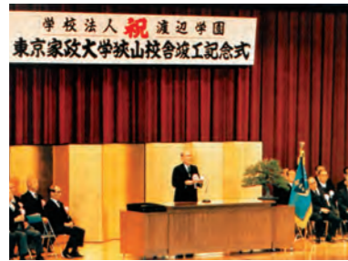
狭山校舎竣工記念式典