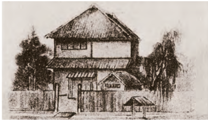
校祖・渡邊辰五郎が本郷湯島の自宅に開設した「和洋裁縫伝習所」校舎