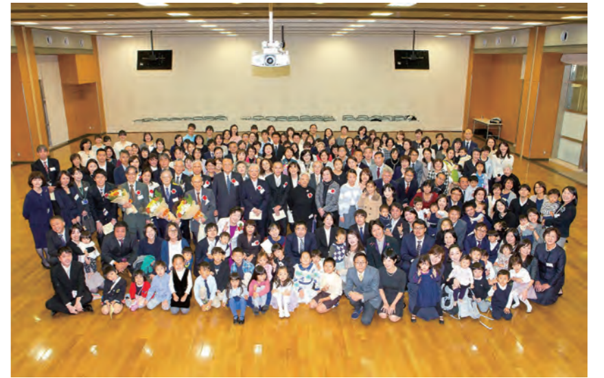
ナースリールーム50周年記念式典