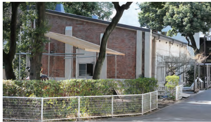
板橋校舎・煉瓦建物(22号棟)