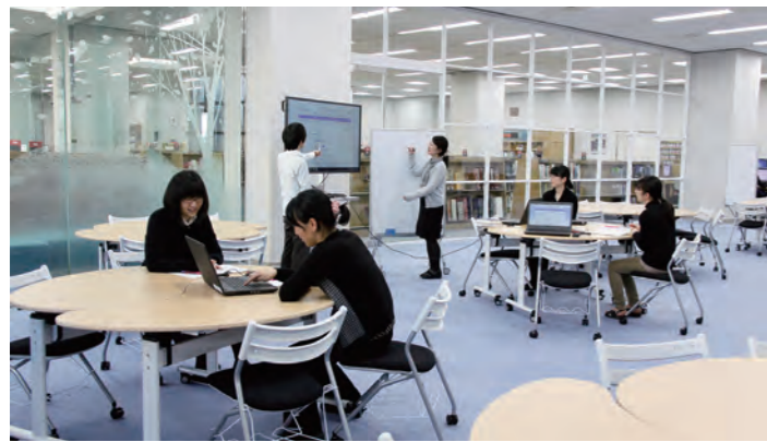
板橋図書館「Lプラザ」