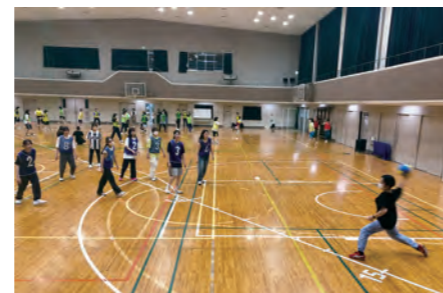
ドッジボール大会