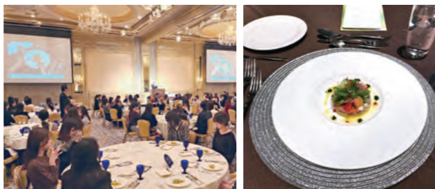
【テーブルマナー講座「西洋料理」】他 日本料理